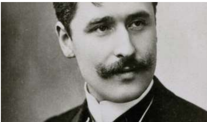
L'auteur : Georges FEYDAU

Où l'on apprend que Galilée, outre le fait qu'il soutenait que la terre tournait autour du Soleil, était aussi un savant bon vivant, généreux, qui n'avait pas hésité à s'en prendre à la toute puissance de l'Eglise. Cette pièce a pour but de faire réfléchir le spectateur à propos des bouleversements qu'amène tout progrès dans la société.