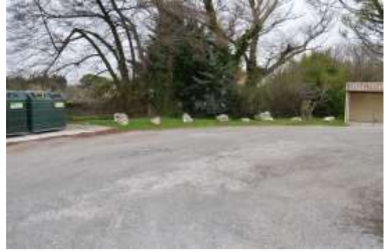
Futur emplacement sur GRILLON

Une réunion d'information et une première permanence sur site auront lieu le vendredi 23 mai à 18h00 , d'autres suivront dans les semaines à venir.