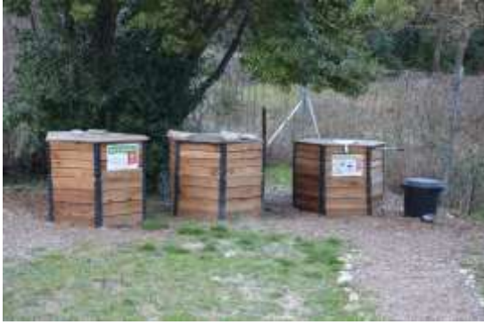
Placette de compostage sur TAULIGNAN