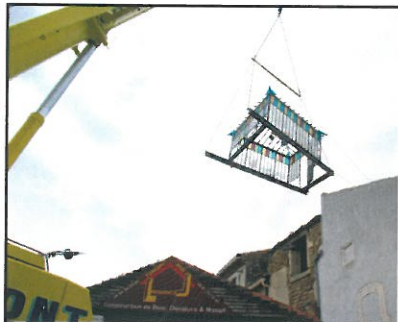
Photo insolite pour vos archives : l'envol de la véranda, précédente énigme de votre Bulletin (voir Lou Grihoun n° 10 et 11). Elle a quitté son « perchoir » de plus de 80 ans pour aller se poser parfaitement quelques mètres plus loin sur un toit terrasse