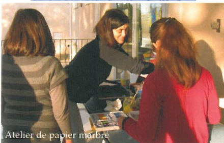
Atelier de papier marbré

Presque 4 000 € ont été récoltés pour le Téléthon cette année. C'est moins que l'année dernière mais tout à fait louable pour un village de notre taille ! Un grand nombre de participants ont pris part aux activités du vendredi soir et du samedi matin mais le samedi après-midi a été malheureusement très calme.